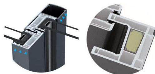
Montant central 35 mm