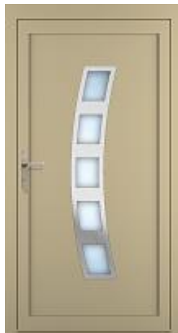
P42 avec décor inox