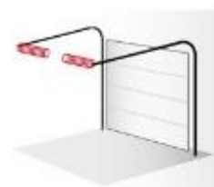
Ressorts de traction latéraux